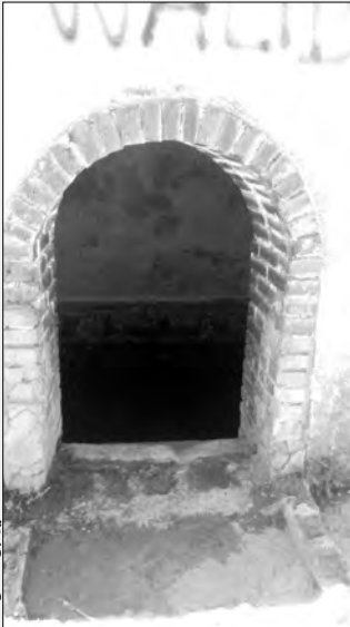
عين بن نعمان