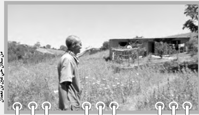
من سكان حي عين بن نعمان

مسيون تماما، تقول أحدهما، مؤكدة أنها تعيش بمنزلة متاهلة رفقة 6 أبنائها على أرض ملك لوالدها يحي عين بن نعمان، بعد أن غادرتها سنوات الإزهاق إلى منطقة بواحمد ببلدية الثنية المجاورة، لكن العودة بالنسبة إليها ولا يمانها أصبحت مرة لغياب أبسط الاحتياجات، وحسبها فإن أقرب دكان يبعد عنهم مسافة تزيد عن 1 كلم، ولا وجود لقاعة علاج من أجل حقنة.. والطريق