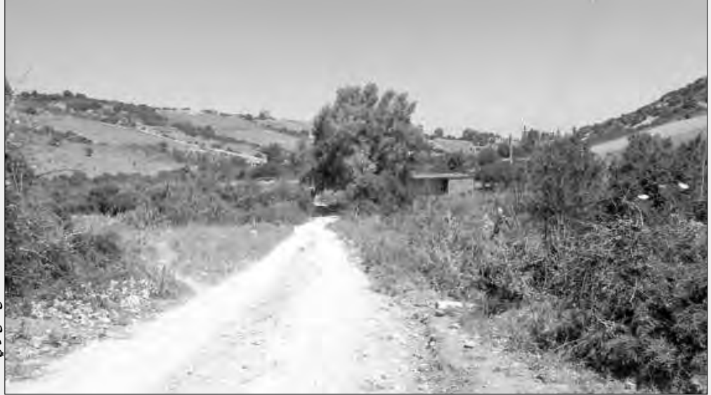
مسلك إلى أعلى الجبل

يطلب سكان حي عين بن نعمان ببلدية زموري بولاية بومرداس، بحقهم في التنمية، لا سيما تهيئة الطريق والإدارة العمومية، وتحسين التزويد بالماء الشروب، وتهيئة شبكة الصرف الصحي المنعدمة تماما في الحي، الذي وصفوه بـ "منطقة تحت مستوى الظل" لانعدام أبسط شروط العيش الكريم. كما أكدوا أن "الأميار" المتعاقبين على البلدية يطلقون وعودا كاذبة خلال الحملات الانتخابية بدون تحقيق التنمية المنشودة، حتى بعد قرابة 60 سنة من الاستقلال.