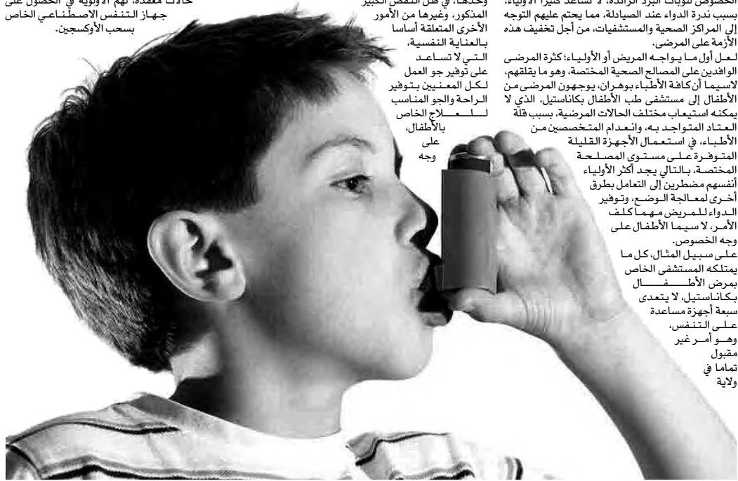
بالأطفال، على وجه الخصوص.

على سبيل المثال، كل ما يمتلكه المستشفى الخاص بمرض الأطفال بكاناستيل، لا يعتد سبعة أجهزة مساعدة على التنفس، وهو أمر غير مقبول تماما في ولاية