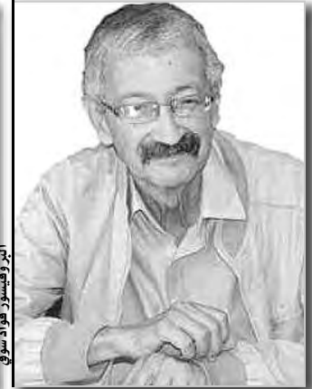
الدكتور بوفيسور فؤاد سوفي