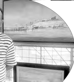
التأطير: حيث إن الرسم عملية بناء داخلي قبل أن تكون فنا.

يعتمد هذا الفنان الأسلوب التجريدي، لكونه يحمل نظريات جمالية أكثر منها رؤى أو قناعات أيديولوجية. كما أن هذا الأسلوب هو الأكثر حرية، والأكثر انفعالا والأكثر صعوبة، وغالبا ما يكون التعبير في هذا الأسلوب من خلال الألوان؛ باعتبارها الأقدر على تقديم الفكرة وترجمة معاني الرسم، الذي هو عملية داخلية وجدانية قبل أن تكون مجرد فعل ميكانيكي عادي، وهنا يعبر شافة بالألوان والأشكال، ويطلق العنان لخياله ومشاعره، لتتجلى المواضع، منها المرأة والوطن، وغيرهما من المواضيع. ومن جهة أخرى، يخصص هذا الفنان على صفحته الإلكترونية، جانبًا للحديث عن الحجر الصحي، ويقول إن أهم جانب فيه هو أنه ترك متسما من الوقت لإخراج أرشيف الذكريات "التي كنا نظنها ضاعت أو تمزقت". ويضيف: "أخرجت رسومات لي منذ سنة 1987، كان عمري حينها 20 عاما وأنا أطرحتها لجمهوري عبر الفيسبوك، ولأصدقائي الفنانين منهم