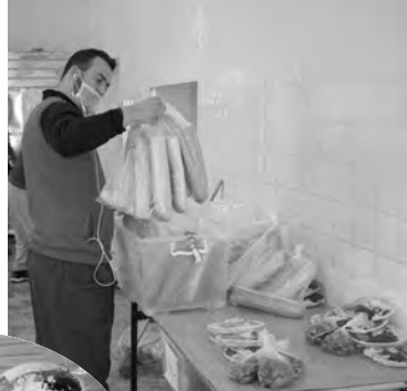
المدومة والهشة، موزعة على الأوحاش المحصية كمناطق ظل، بالإضافة إلى بعض