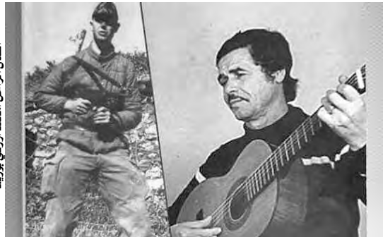
الفنان الراحل امحمد أرزقي بوزيد

فيها العمل بعد الاستقلال سنة 1962، بجانب فنانيين كبار، مثل الشيخ نور الدين وشريف خدام، وعرف الراحل أيضاً بمغني الجيل الثاني، وقدم مساعده للعديد من الفنانين الشباب.