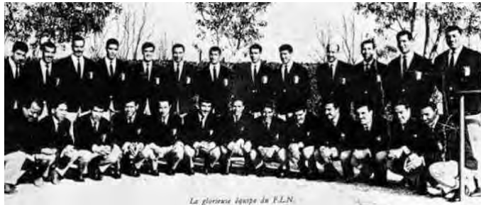
La glorieuse équipe de F.L.N.

تجوب العالم". ويعد انتهاء الزيارة إلى الفيتنام انتقل الفريق الجزائري إلى جمهورية مصر العربية لكن بدون مشاركة في أي مباراة: حيث كان هذا البلد يخشى من تعرضه لعقوبات الفيفا، التي كانت واقعة آنذاك تحت تأثير فرنسا. وقد تذكر المرحوم أمقران وليكن بكثير من الشغف، الشعب المصري بمشاهدة فريق