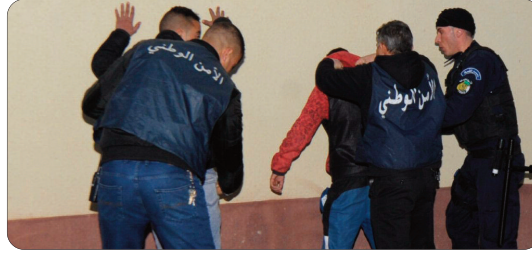
(2) وحجز قارورتين (2) غاز البوتان وكمية من الأسلحة البيضاء، متمثلة في سيوف وعصي يستعملونها في عمليات السطو والاعتداء. وأوضح البيان أن "أفراد المجموعة الإجرامية أثناء محاولتهم تنفيذ عملية

تمكن أفراد الفرقة الإقليمية للدرك الوطني بأولاد فایت، رفقة أفراد فصيلة الأمن والتدخل بالشرافة، من إلقاء القبض على المشتبه فيهما (2) في محاولة سطو على محل تجاري باستعمال أسلحة بيضاء وقارورة غاز، حسبما أوردته أمس، بيان للخلية الاتصال للمجموعة الإقليمية للدرك الوطني بالجزائر.