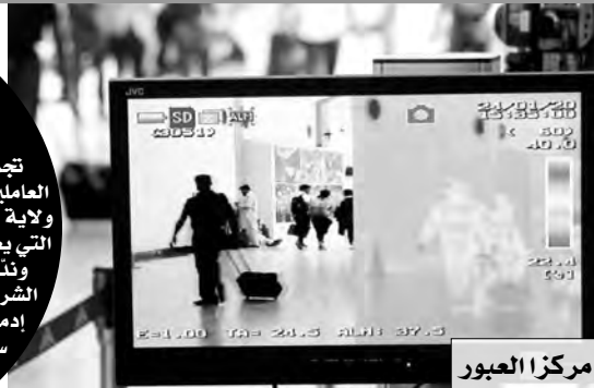
مركز العبور الحدودي بأولاد مومن