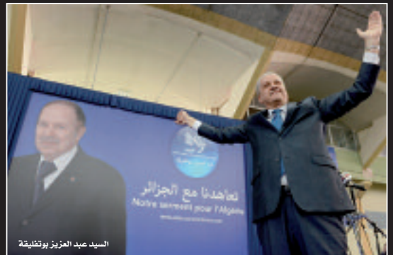
السيد عبد العزيز بوتفليقة