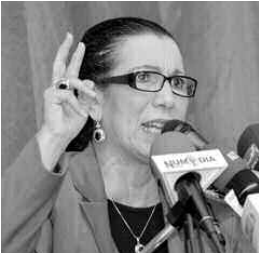
الحملة الانتخابية لرئاسيات 2014 جمع ولاية باتنة

وقالت مرشحة حزب العمال، خلال تجمع بعاصمة الأوراس، لقد رشحتني حزب العمال لرئاسة الجمهورية لكي أرفض هذا إذا كان ثمة جزائر مفتتة وإذا تم انتخابي ساكون ريسة كل الجزائريين وليس رئيسة للمنطقة التي أُنحدر منها أو الولاية التي أنا مسجلة بها.