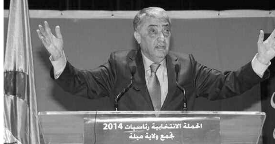
الحملة الانتخابية لرئاسيات 2014 جمع ولاية ميلة

وإلى المتحدث، فإن ما يلزم إعادة البلاد إلى الطريق السليم هو "تعميم المصالحة الوطنية" لتضييق الجراح وإرجاع الحقوق لأصحابها وفتح عهد مصالحة الكاملة الشاملة وإرجاع لكل ذي حق حقه، متسائلا في هذا الإطار كيف يمكن أن نصلح الأمور ونغيب حيرة العديد من المواطنين والمواطنات، ليستطرد قائلا لابد من اعتراف الدولة باخطائها، لأن ذلك يزيد من هيبتها ويرفع شأنها ويكسبها رضا الشعب والمظلومين من فئات أكانوا.