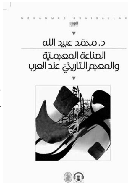
صدر كتاب «الصناعة المعجمية والمعجم التاريخي» للكاتب محمد عبيد الله

معجم إضافي له قيمته وخصوصيته وشخصيته، ولكنه ليس إصلاحاً إلى إصلاح، وأن وظيفته مختلفة عن المعجم، وإنما هو