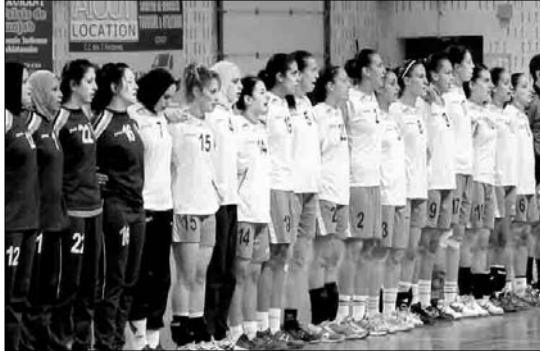
المتمازة (رجال وسيدات) للموسم 2019/2020.