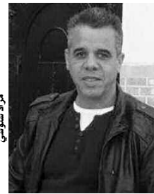
تيزي وزو خلال الأسبوع الجاري.