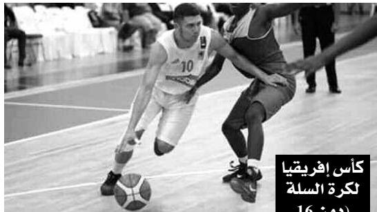
كأس إفريقيا لكرة السلة (دون 16 عاما-ذكور)

وفي سياق متصل، اعتبر مسؤول العلاقات الدولية بالاتحاد الدولي لتيك بول، أن ممارسة هذه الرياضة على مستوى المدارس سيضمن لمجال قاعدة شبابية وبالتالي ضمان صيرورة ممارستها من جهة وكذا إنشاء أندية محلية من جهة أخرى. وعن مساعدات الاتحاد الدولي، ذكر مريوس فيز، أن الهيئة الدولية تمنح كل الوسائل التقنية والفنية المتوفرة على مستواها للدول التي تبني فكرة ممارسة تيك بول على مستواها، وقال في هذا الشأن: "سنعمل بنفس البرنامج التطويري الذي طبقناه على كل من نيجيريا، مدغشقر