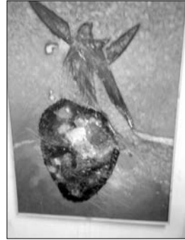
المعارض المغلقة، ولا يهيمه عرض مجموعاته وبيعها، فهو يفضل الناس بكل شرائحهم؛ من أطفال وشباب ومسنين وغيرهم.

ويتنقسم الجمهور عند هذا الفنان الأكاديمي المحترف، إلى فئتين: فهناك الجمهور المثقف الذي يحمل أفكارا ورؤى فنية، وهناك عموم الشعب الذي لا يدرك هذا الفن، وهنا مطلوب من الفنان أن يجعل فنه مشاعرا، وأن يلتزم بديمقراطية الفن، ليؤكد أوشان أنه يميل إلى الفئة الثانية؛ لذلك يفضل العرض في المساحات المفتوحة وفي المقاهي والساحات العمومية ليحسك بالشعب، وبالمقابل لا يميل كثيرا إلى