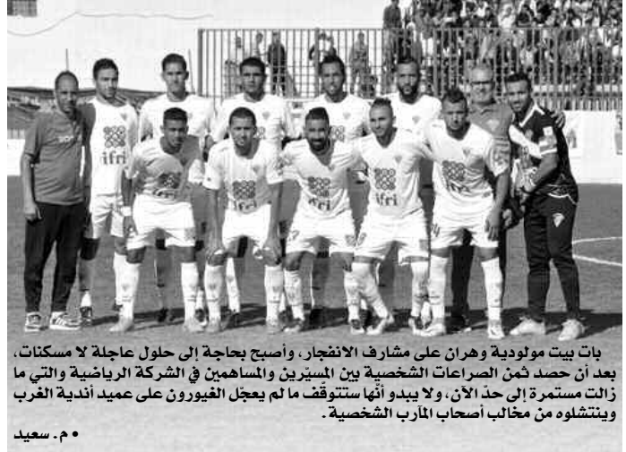
بات بيت مولودية وهران على مشارف الانفجار، وأصبح بحاجة إلى حلول عاجلة لا مسكنات، بعد أن حصد ضمن الصراعات الشخصية بين المسيرين والمساهمين في الشركة الرياضية والتي ما زالت مستمرة إلى حد الآن، ولا يبدو أنها ستوقف ما لم يعجل الغيورون على عميد أندية الغرب ويتشلهون من مخالب أصحاب المارب الشخصية.