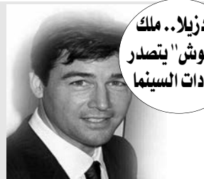
غودزيلا.. ملك الوحوش يتصدر إيرادات السينما

وبينما يتصدر فيلم غودزيلا دور العرض، تراجع فيلم الخيال "علاء الدين"، وهو من بطولة مينا مسعود ونعومي سكوت وويل سميث ومن إخراج غاي ريتشي، إلى المركز الثاني هذا الأسبوع، مكتظا بتسجيل 42.3 مليون دولار، واحتل الفيلم الموسيقي الجديد "وكيتمان" الذي يتناول حياة الفنان البريطاني الشهير