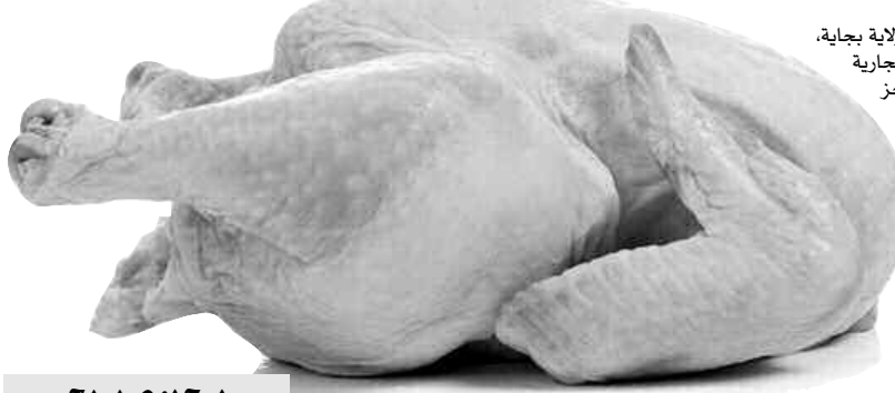
• الحسن حامة