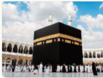
القبلة أو التحقق من اتجاهها بالنسبة للمناطق أو الدول

خلال نصب عمود قائم على سطح الأرض أو عمود إنارة كهربائي مثلا والنظر نحو الجهة المعاكسة لامتداد ظل ظلهم في جهة القبلة. للإشارة فإن عدة مناطق صحراوية في جنوب الجزائر التي تقع على نفس خط العرض لمدار السرطان (23.5 درجة قوسية) أو دونه مثل تمنراست وعين قزام، تشهد تباعا نفس ظاهرة اختفاء نشاطات الظل وقت الزوال، أي عندما تستقط أشعة الشمس عمودية عليها، مما يسمح لها أيضا بحساب محيط الأرض بطريقة رياضية بسيطة.