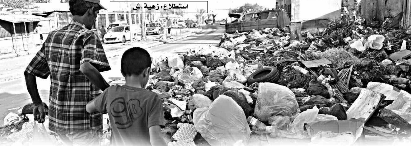
استطلاع: زهية ش.

تشهد عدة بلديات بالعاصمة انتشارا فظيعا للنفايات التي زادت حدتها خلال الشهر الفضيل، بسبب التجارة الفوضوية التي عمقت المشكل، حيث أصبحت القمامة ديكتورا يميز الأحياء وحتى الشوارع الرئيسية رغم الجهود التي تبذلها مؤسسات النظافة، مما جعل الوالي الجديد للعاصمة عبد الخالق صبيدة، يؤكد في أول لقاء له برؤساء البلديات، على ضرورة الحفاظ على نظافة المحيط. وتوفير إطار معيشي مناسب للمواطنين، من خلال صيانة المفرغات على مستوى العمارات ونظافة الطرق والمساحات الجوارية والأماكن العمومية باستعمال إمكاناتها، وعدم الاعتماد على المؤسسات العمومية الولائية فقط، التي تقوم بمجهودات جبارة، على غرار مؤسسة "نات كوم" التي جمعت 18 ألف طن من النفايات و12 طنا من الخبز خلال 12 يوما من رمضان.