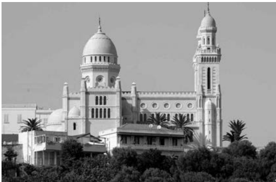
مسجد "أبو مروان الشريف"

وبإعادة فتح مسجد "أبو مروان الشريف" من جديد، أبدى المنابيون وخاصة سكان وسط المدينة وأبناء الحي العتيق اعتزازا وفخرا كبيرين كلما تعالي من أعالي منارة المسجد بالمدينة القديمة أذان الصلاة بمناسبة الشهر الفضيل، حسبما أعرب عنه العديد من رواد هذا المسجد.