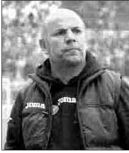
يكونوا متواجدين على المدرجات لمساندتهم وتشجيعهم من أجل تحقيق المطلوب.