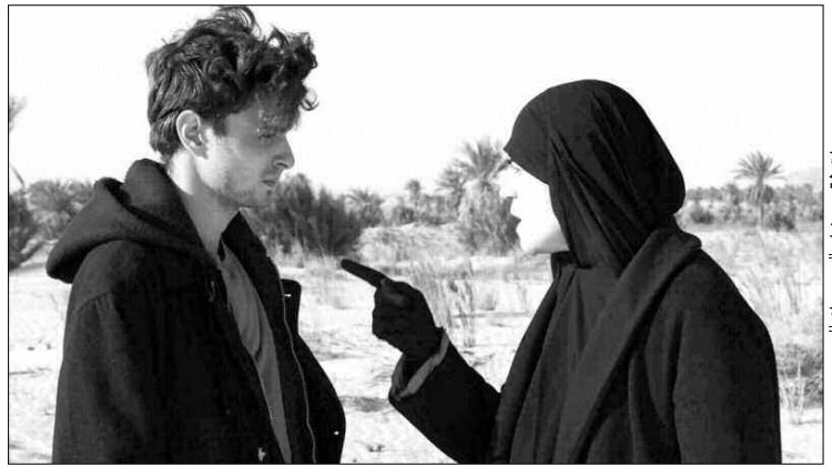
لقطة من فيلم "ريخ ربابي".

وضمان حسن استغلال هذه المرافق لاسيما بالنسبة للمناطق التي تفتقر لمؤسسات ثقافية، علما أن هذه المرافق التي تم الانتهاء من أشغال إنجازها، تم تجهيزها بكل الضروريات، ليجد قاصدوها الأجواء المواتية. وذكر مصدر من قطاع الثقافة للولاية، أنه تم توفير أعوان في إطار مختلف إجراءات ما قبل التشغيل، لسهل على استغلال وتسيير هذه المرافق، غير أن هذا يتطلب مساعدة ومراقبة القرى والسلطات المحلية لضمان حسن استغلال كل من المكتبات وقاعات المطالعة.