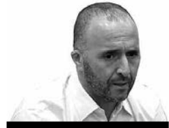
جمال بلماضي (مدرب المنتخب الوطني)؛