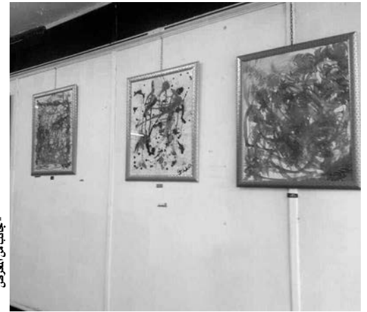
جانبا من المعرض

عموما، فقد استطاع هذا الفنان الشاب تحطيم الحواجز وتصنيف الأفكار من