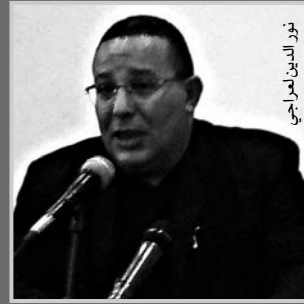
نور الدين المرارجي