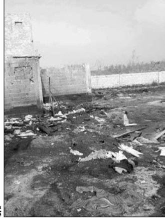
منطقة شطيبو ببلدية سيدي الشحمي