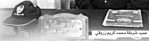
عمید شرطه محمد کریم زروقی

جعلنا نهتم بالبحث في هذا الموضوع والبيئة كانت من أمن دائرة برج مناييل. 334 حالة سرقة جوالاً بيوبرداس في الموضوع عينتنا رئيس أمن دائرة برج مناييل عميد شرطة محمد كريم زروقي، فيقول إن أمن ولاية بومرداس سجل خلال الستين الأخيرين 334 حالة سرقة جوالاً بكل إقليم الاختصاص تمكنت عناصر الأمن من استرجاع 89 جوالاً. موضوعاً بأن هذه الظاهرة تناقصت بشكل كبير عما كانت عليه في سنوات خلت بفضل التحسيس حول سرقة الجوال كمنهجية هذه القضايا الأمر الذي أكسبه تجربة وأصبحت قضايا سرقة جوال لا تستغرق مدة طويلة لتعومها، كما يؤكد المسؤول بأن تكثيف العمل التعاوني لخملة الاتصال بأمن الولاية كان له الصدى الإيجابي لدى المواطن الذي أصبح يبلغ عن حالات سرقة قد يكون ضحية لها، وهو ما سمح لعناصر الشرطة بالتدخل في الوقت المطلوب ووضع حد لآراجام بمقتضى هذه الظاهرة مع وشارة الجولات المستعملة قال عميد الشرطة زروقي، بأن مصالحه عالجت 42 قضايا أغلبها خاضعاً لتقوما قضائياً كونهم باعوا أو اشترأوا هاتفاً نقولاً محل