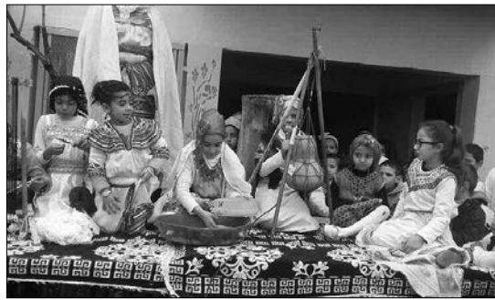
الأمازيغي يومي 14 و 15 جانفي الجاري.

الحكمة الوطنية وخدمة الشعب الجزائري بها.