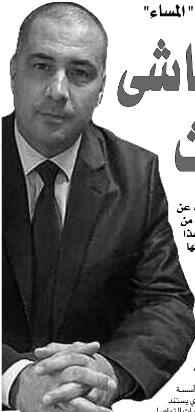
هيكلة ديوان الزكاة:

مما يجعلنا لا نجد نحن أيضا حرجا أو مانعا من الاستفادة من تجارب دول أخرى في هيكلة صندوق الزكاة؛ كون "المأسسة" في هذا العصر مشتركة إنسانيا، كما أن على مستوى التاريخ كلما ظهر الإطار المؤسسي للزكاة إلا وقويت الزكاة، ويتم التحكم فيها أحسن جمعا وتوزيعا حتى تبلغ مقاصدها بطريقة أحسن، ويكفي الإشارة إلى