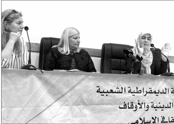
الديمقراطية الشعبية الدينية والأوقاف قائمة الاسلام

أن يقابلها من علاجات وحلول تساهم. ولو بالقليل. في دعم هذه المرأة التي يراهن عليها المجتمع لصالحه. في السياق، دعت الجهات المعنية إلى الاهتمام أكثر بالجانب النفسي للنساء، من خلال عقد اللقاءات والندوات العلمية بمشاركة أخصائيين، من أجل المساهمة في توعيتها وتقويتها، ولما لا ربطها بمن يمكنه توجيهها ودعمها.