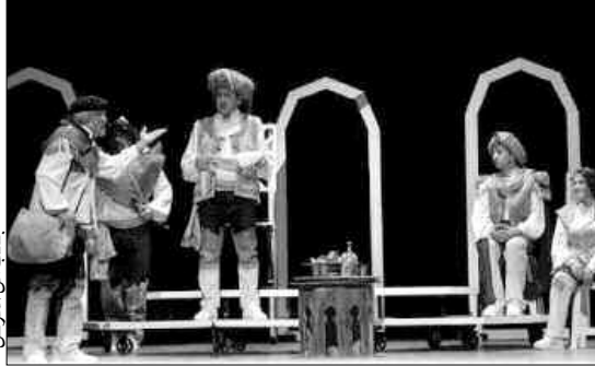
الافتتاحية للمسرح الوطني