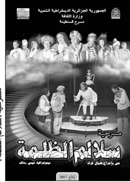
مسرحية سلام الظلمة