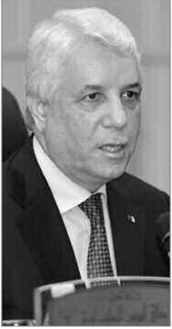
كآلية للمراقبة القضائية سابقاً.

ويهدف هذا النص إلى إعادة الإجماع الاجتماعي للمستفيد منه بقضاء عقوبته أو ما تبقى منها خارج المؤسسة العقابية، وبالتالي التقليل من حالات العودة إلى الإجماع، كما يسمح بتقليل مصاريف التكفل بالمحبوسين داخل المؤسسات العقابية وتجنب الاكتظاظ بها.