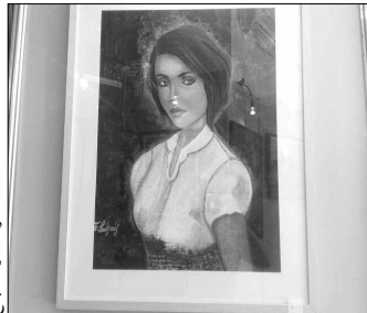
لوحة فنية من مجموعة عشاب