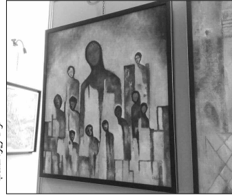
لوحة فنية من مجموعة فاسي