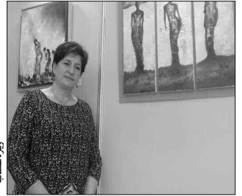
لوحة فنية من مجموعة لجاج