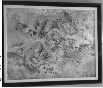
لوحة فنية من مجموعة عشاب