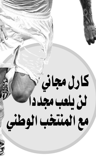
كارل مجاني لن يلعب مجددا مع المنتخب الوطني

لنهائيات كأس إفريقيا للأمم 2019، ولا يبدو على المدرب الإسباني أنه ينوي الرحيل من المنتخب الوطني، فهو يصبر