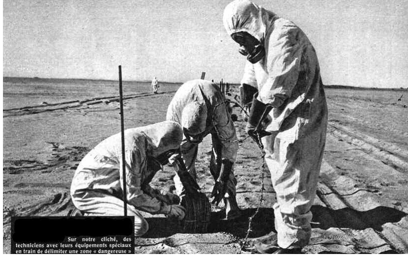
Sur notre cliché, des techniciens avec leurs équipements spéciaux en train de délimiter une zone « dangereuse »

وأن الطرف الفرنسي استخدم أقدر نوع من المفرقات وهي مادة البلوتونيوم التي يبقى تأثيرها الإشعاعي قائما لـ 24 ألف سنة. إضافة إلى إعانتها بأنها قامت بكل الاحتياطات غير أن الدراسات الأمريكية أكدت أن التجارب النووية الفرنسية في منطقة أرغان وصل تأثيرها إلى مالي والنيجر، وهناك شهادات عن سحابت مشعة وهطول أمطار في دول أخرى.