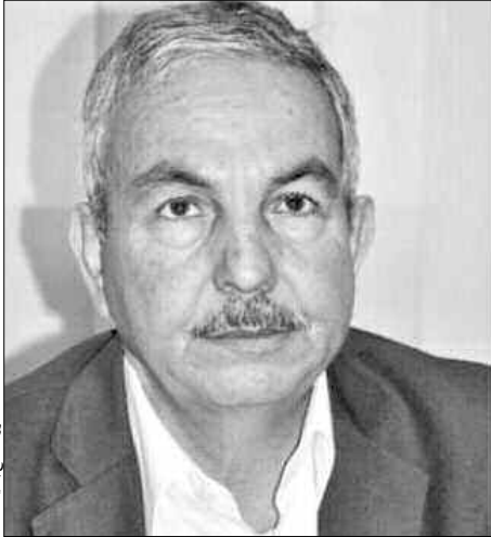
الدكتور صالح بلعيد

تملك الإحسان الاستشارة. وفي هذا السياق، أمل أن تزدهر اللغة العربية، وستزدهر هذه اللغة؛ لأن الإرادة السياسية موجودة، وهناك أناس يشغلون بالمجان لتحقيق هذه الغاية.