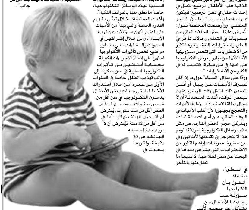
في النطق، مضيفة: "القول بأن التكنولوجيا مسؤولية عما يحدث للأطفال من مشاكل، غير صحيح؛ لأنها

أطلقت المنظمة الوطنية لحماية وإرشاد المستهلك ومحمطة، حملة توعوية لتوعية لعلاقة الصيام والتحكم في السمّة، والتي تواصلت بعد الشهر الفضيل، وخلال صيام ست أيام من شهر شوال. وأكد أعضاء الجمعية أن الصيام قد يساعد في التحكم في السمّة، خصوصا أنه يساهم في التقليل من الوجبات المستهلكة خلال اليوم الواحد شرط أن لا يتم استهلاك وجبة الفطور بكمية كبيرة، ما يجعل من هدف التقليل يروح هباء منثورا. ولا يزال موضوع السمّة المفرطة من المواضيع الصحية التي كثيرا ما تثير قلق الأطباء وخبراء الصحة، لما يمكن هذه الحالة أن تقود إلى العديد من الأمراض المرتبطة بها، كالسكري، وضغط الدم، وتصلب الشرايين، والأمراض، وضيق التنفس، وغيرها من الأمراض التي قد تكون أكثر خطورة؛ بشكل أصبح يمس مختلف شرائح المجتمع حتى الأصغر سنا؛ إذ تم تسجيل أكثر من 18 % من أطفال الجزائر يعانون السمّة، وهذا الرقم وسمته خبراء الصحة بالكبير، خصوصا أن هذا الشكل قد يقود إلى العديد من الأمراض لم نعهد تسجيلها لدى فئة الأطفال سابقا. وتزامنت الحملة مع بداية شهر شوال، شهر صيام الصائرين، والتي يحرص عليها الكثير من الجزائريين؛ لاكتساب أجر سنة كاملة من الصيام. وأشار القائمون على الحملة إلى أن الصيام يساعد كثيرا من الذين يعانون السمّة، في التحكم في وزنه، من خلال تقليل الوجبات، لكن شرطة تخفيف الأكل في الإفطار وليس تحويل هذه الوجبة إلى وجبة تجمّع وجبتين أو أكثر، موضحين أن الكثيرين يستقلون الصيام لرجعة صحتهم، والابتعاد عما قد يعرض صحتهم للخطر، خاصة أن السمّة تعرض الفرد للكثير من المشاكل الصحية متوافقة الخطورة، ومنها التي قد تهدد، تمام، حياة الإنسان. نور الهدى بوطييبة