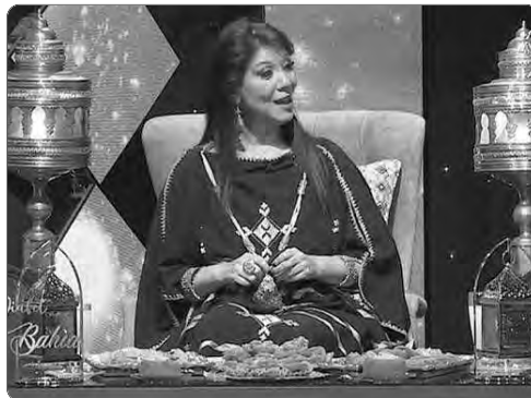
منهم ببلادهم القارة.

إذا كانت "كنال الجيري" أخذت حصة الأسد في هذا المنحى واعتمادها لرمضان مدفع الإفطار الذي يعكس الخصوصية والهوية، فإن قنوات التي اعتمدت بدورها بالمغتربين، فيض القنوات الخاصة نقلت يومياتهم ولبت طلباتهم من برامج فنية ودينية وغيرها، كما حرصت قناة "الذاكرة" على استغلال رمضان لامتاع هذا الجمهور ليتذكر رمضان البلاد ورمضان زمان، إذ لا تحلو الملمات دون السكاشات التي بقيت حية لا يملها الجزائريون.