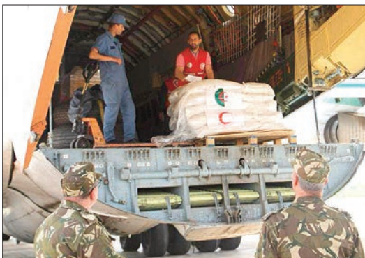
الغذائية تقدر بـ162 طن عبر القاعدة العسكرية ببوفاريك متجهة نحو مطار العريش بمصر». وأضافت المتحدثة، أن حجم المساعدات التي قامت

وكأن الهلال الأحمر الجزائري قد أرسل في 24 مارس الجاري، 150 طن من المساعدات الإنسانية إلى الأشقاء الفلسطينيين عبر القاعدة العسكرية ببوفاريك تطبيقًا لأوامر رئيس الجمهورية، حسب بيان لهذه الهيئة.