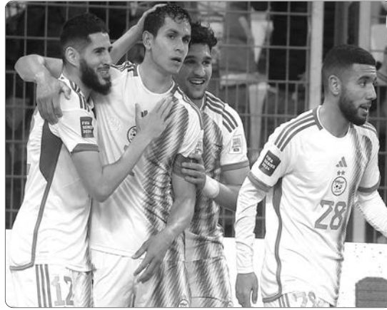
الحار، وجميع الوسائل التي وضعت تحت تصرفه من طرف أعضاء "الفاف" أثناء إقامتهم في البلد. وأكد هوغو بروس، مدرب جنوب إفريقيا،

على فائدة مثل هذه البطولات لتقدم المنتخبات، قائلا: "أنا سعيد بالطريقة التي سارت عليها هذه البطولة، بفضل هذا النوع من المنافسات تتقدم المنتخبات، نجد صعوبات في تنظيم المباريات الودية، والقدرة على الاستفادة من مثل هذه البطولة لمواجهة منتخبات مرموقة مثل الجزائر، هو أمر رائع". ومن جانبه، أعرب الوفد الأندوري عن سعادته بالإقامة في عنابة، كما شكر الاتحاد الجزائري لكرة القدم على الترحيب، والسكان المحليين لمدينة عنابة على حسن ضيافتهم. وقامت خلية الإعلام في اتحاد أندورا، بعمل فيديو عن مدينة بونة، نشرته عبر حساباتها على مواقع التواصل الاجتماعي، سجل مشاهدات عالية، فاقت 310 ألف مشاهدة. وأثبتت الجزائر بفضل بنيتها التحتية الحديثة، أن لديها كامل الإمكانيات لاستضافة أكبر الأحداث الرياضية القارية، حيث غادر ضيوف الجزائر بلادنا بارتياح كبير، وبعد ألعاب البحر الأبيض المتوسط، "الشان"، وكأس أمم إفريقيا تحت 17 سنة، ودورة فيفا سيري.